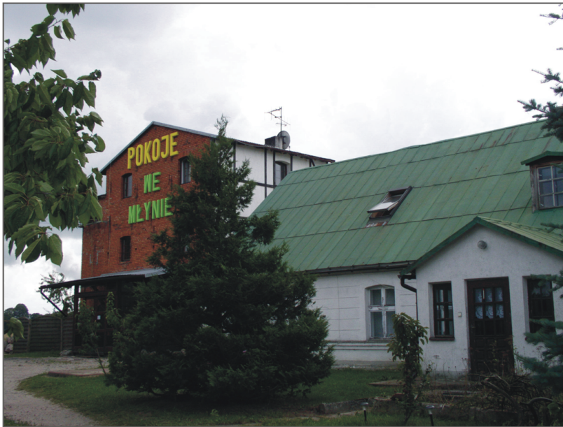
A. Bobrowice. Gospodarstwo agroturystyczne.