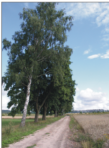
B. Droga widokowa Sławno–Radosław.