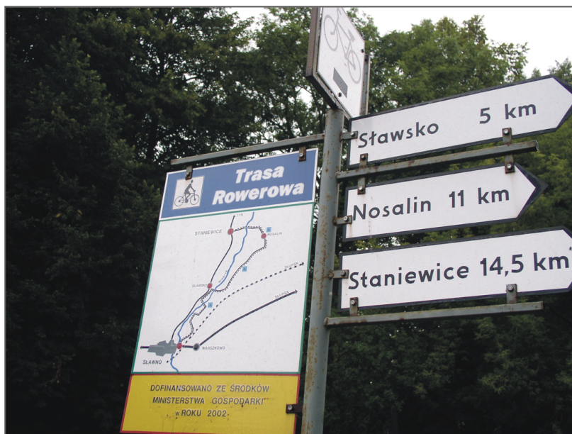
A. Sławno. Oznaczenie szlaku rowerowego.