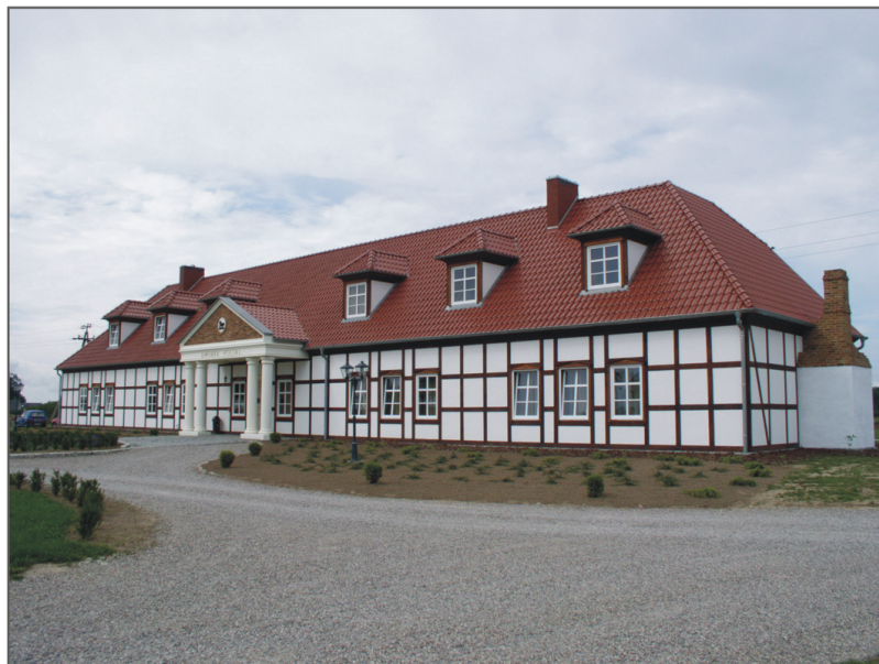
B. Rzyszczewo. „Dworek Polski” – zajazd przy drodze Sławno–Koszalin.