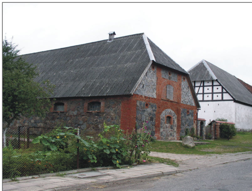
B. Żukowo. Gospodarstwo agroturystyczne.