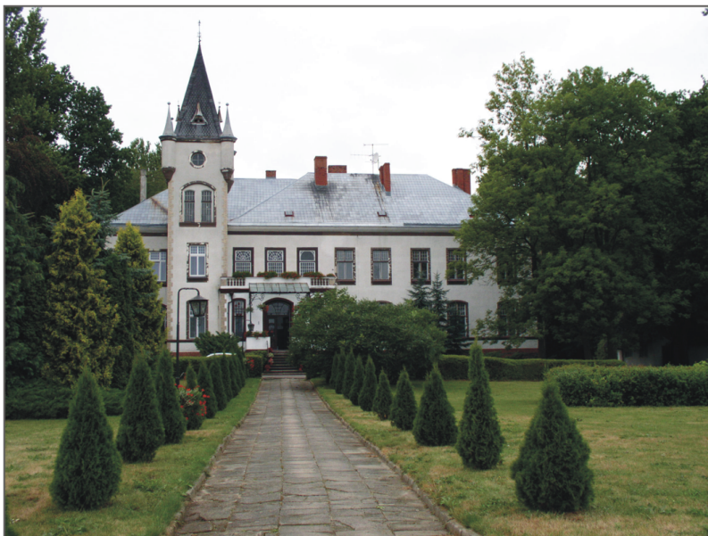
A. Noskowo. Zabytkowy pałac i park.