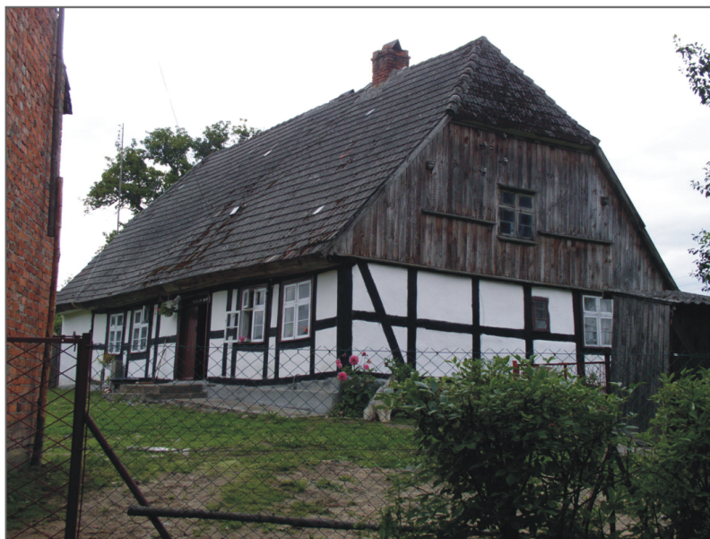
B. Stary Kraków. Obiekt zabytkowy o cechach regionalnych.